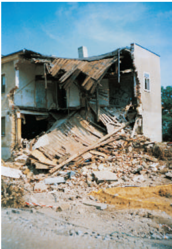
Abb. 4: Katastrophenschutz (hier beispielsweise Flutkatastrophe 2002) im eigentlichen Sinne in Deutschland nicht existent?

2. Eine explizit notfallbezogene Erziehung von Kindern findet – im Gegensatz zu anderen Ländern (21) – an deutschen Schulen und Kindergärten nicht statt; in den jeweiligen Lehrplänen sind z.B. Erste-Hilfe-Unterricht und Brandschutzerziehung schlichtweg nicht enthalten (18). Obwohl sich in der jüngeren Vergangenheit zahlreiche Notfallsituationen mit vielen Toten und Verletzten in Schulen ereignet haben (31), sind pädagogische Konzepte zur Vorbereitung der gesamten Schulgemeinde auf solche Notfälle bis heute nur in Ausnahmefällen vorhanden (16). Entsprechender