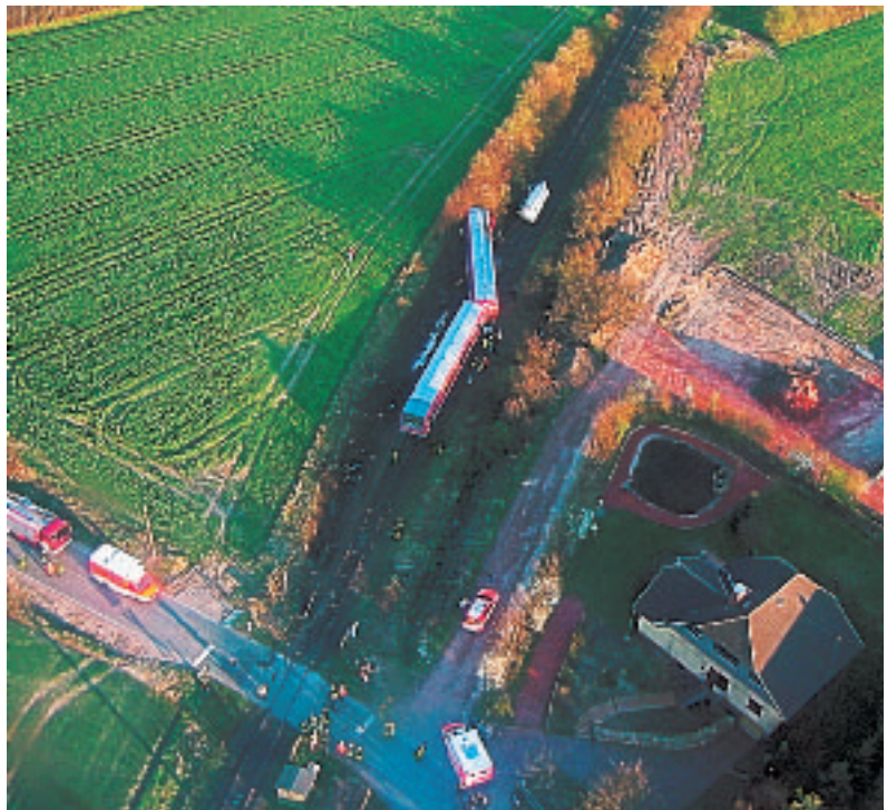
Abb. 3: Leider allzu häufig Gegenstand der Berichterstattung: Unfälle mit Bussen und Bahnen – Sicherheitshinweise im Vorfeld? Fehlanzeige!

Es wird somit die Frage aufgeworfen, ob Menschen überall dort, wo sie in besonderem Maße mit einer Notfallsituation konfrontiert werden können, ausreichend und angemessen darauf vorbereitet sind; es stellt sich die Frage, was jeweils getan wurde, um Menschen, die eben nicht Mitarbeiter der Feuerwehren und des Rettungsdienstes sind, in die Bewältigung von Schadenslagen einzubeziehen. In einer Studie der Katastrophenforschungsstelle an der Universität