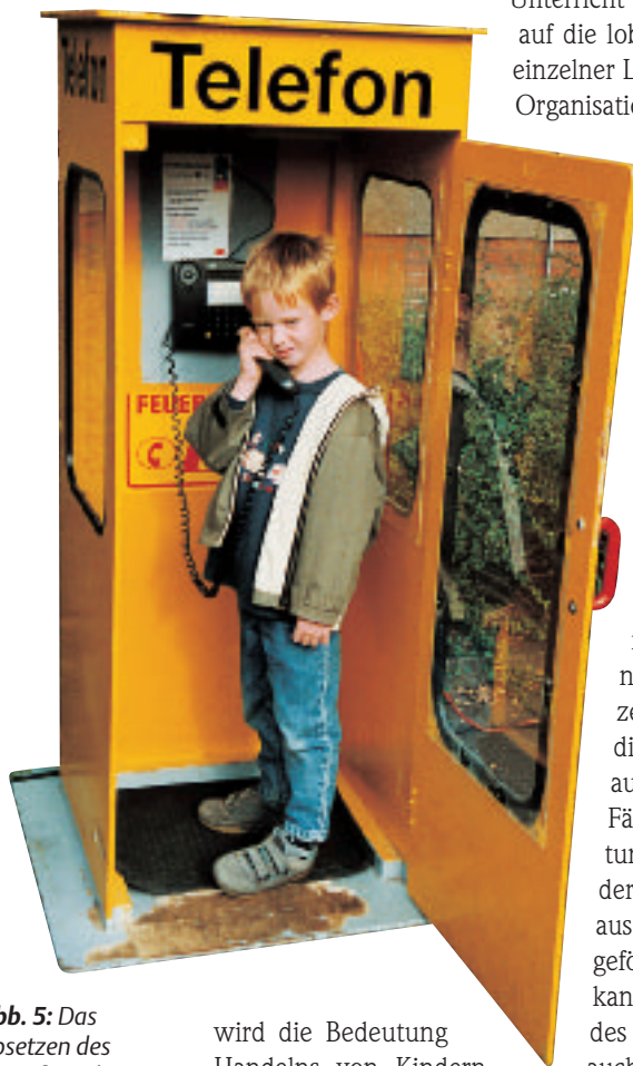
Abb. 5: Das Absetzen des Notrufs und weitere Erste-Hilfe-Maßnahmen könnten Kinder bereits in der Schule lernen

Zum Thema „Schulsanitätsdienst“ siehe auch den Beitrag von Scholl auf S. 89 in dieser Ausgabe